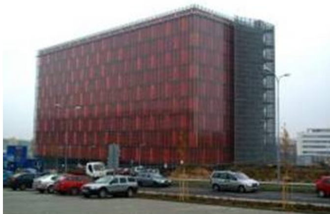
Objekt archiválií MZA