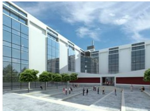
Vizualizace - nádvoří