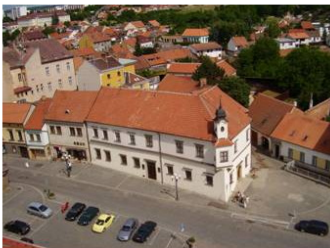
Dům, kde se konal moravský zemský sněm, dnes muzeum.