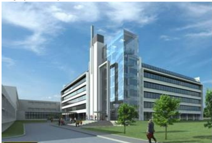
Vizualizace - pohled na nárožní věž

Pavilon velkých poslucháren Fakulty stavební VŠB - TU Ostrava. Nový pavilon vyroste v areálu VŠB Fakulty stavební na ulici Ludvíka Poděště v Porubě na konečné MHD "Opavská". Nahradí tak dnes nevyhovující a nedostatečné prostory starých poslucháren v areálu VŠB na ulici 17. listopadu. Jedná se o šestipodlažní budovu, ve které budou umístěny posluchárny s kapacitou 25 až 50 míst, ateliéry, pracovny pro vyučující a dvě velkoprostorové posluchárny, z nichž každá má kapacitu 200 míst. Celkový obestavěný prostor dosahuje 29.200 m 3 . Celková zastavěná plocha 1.816 m 2 . Nosnou konstrukci tvoří železobetonový skelet, střeška je plochá s fasádou s pásovými okny. Jako dominantu objektu navrhli autoři projektu nárožní věž s ocelovou nosnou konstrukcí opláštěnou strukturálními prosklenými stěnami. Stavba byla zahájena v srpnu 2007 a její dokončení je naplánováno na IV.čtvrtletí 2008. Celkové náklady činní 177,2 mil. Kč bez DPH. Výstavbu zajišťuje OHL ŽS, dle projektu firmy PPS Kania