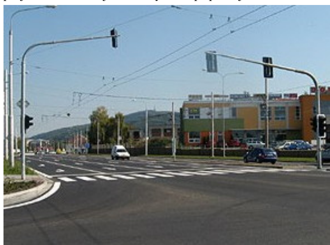
Silnice I/49 Zlín – Malenovice