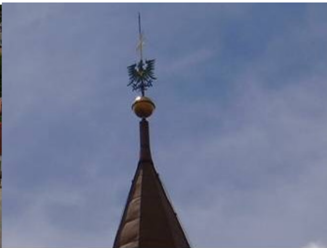
Ivančická kostelní věž s moravskou orlicí.