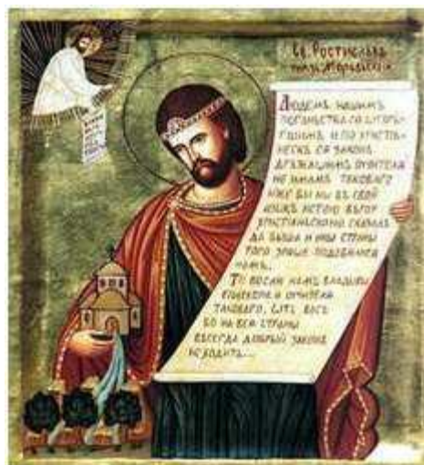
Moravský kníže Rastislav v idylickém zobrazení pravoslavné církve.

Roku 863 nebo 864 8 dorazili solušní bratři na Moravu. Byli okázale přivítáni. Aristokracie naší země byla v tu dobu již křesťanská, i na jistém kultivačním stupni. Mezi ní a prostým lidem byl ale propastný rozdíl. Těžko říci jaké pocity měli Konstantin a Metoděj z našeho tehdejšího prostředí. Překvapilo je množství kamenných kostelů, když byli připravováni takřka na pohanský svět? Snad. Na druhou stranu zřejmě postrádali přísnější řád a křesťanské mravy museli zdůrazňovat i urozeným. Morava při příchodu Konstantina a Metoděje sice nebyla pohanská, 9 křesťanství se však dotýkalo