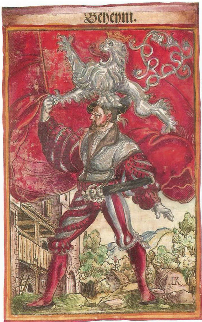
Český zemský prapor. Erbovní kniha Jacoba Koebela, 1545.