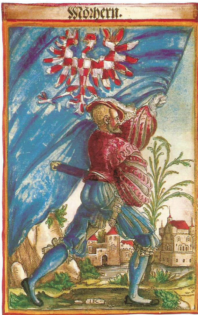
Moravský zemský prapor. Erbovní kniha Jacoba Koebela, 1545.

v roce 1968, kdy v souvislosti s připravovanou federalizací státu na Moravě vzniklo dnes velmi málo připomínané úsilí o vytvoření moravskoslezské republiky jako jedné ze tří součástí plánované federace, které získalo na Moravě překvapivou lidovou podporu. Právě pro zapojení mnoha běžných lidí do tohoto úsilí veřejné užití moravské vlajky můžeme předpokládat, doklady však zatím scházejí.