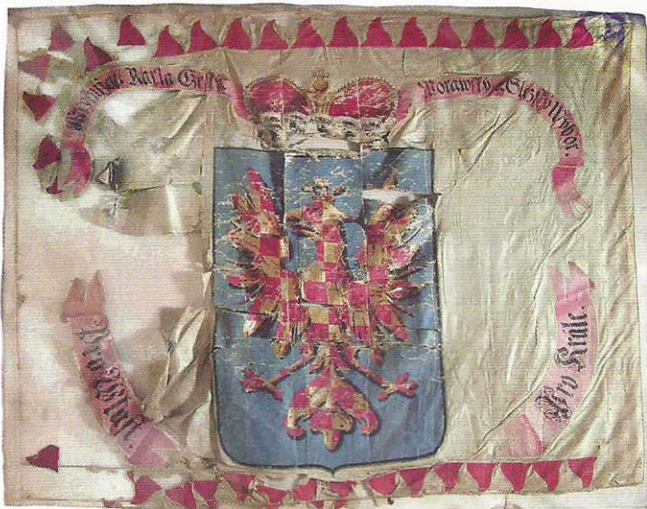
Rubová strana moravského praporu (zlatě-červená orlice) Legie arcivévody Karla. 1800

Vlevo zemské znaky v klenbě Chrámu svaté Barbory v Kutné Hoře.