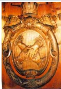
Svorností a práci rodový erb a motto Alberta Kleina

na majetku byl v čase jeho smrti odhadnut na 2,5 miliónů zlatých, dlužil například skromné obnosy knihkupcům či krejčím.