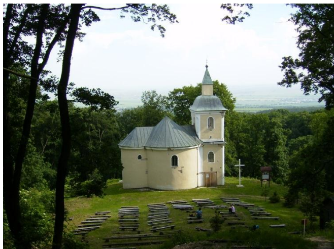
Rotunda Jurko, jejíž základy pochází z 9. století