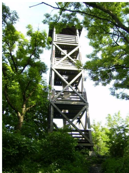
Rozhledna na vrcholu Marhátu

Na jižním úpatí Marhátu se nachází jedna z nejstarších památek na Slovensku – rotunda svatého Juraja, jejíž vznik je datovaný už na začátek 9. století. Tou dobou tu stávala osada Púst, významná nejen svou polohou při důležité obchodní cestě, ale taky těžbou železné rudy. Její obyvatelé se později ve středověku přesunuli do níže položené Nitrianské Blatnice. Kostelík byl sice v raném středověku několikrát upravován (díky tomu se patrně zachoval do současnosti), po opuštění osady však postupně chátral.