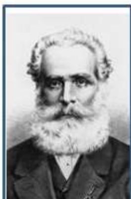
Michael Thonet zakladatel podniku

V následujícím pojednání o podnikatelských fenoménech Moravy v 19. století bych se chtěl věnovat firmě, která nesla jméno dle synů Michaela Thoneta a to Gebrüder Thonet. Na rozdíl od Kleinů se nejednalo o rodilé Moravany, ale o klan, jehož generace se zde teprve usadila. Tato skutečnost, ale nikterak nesnižuje význam a vztah těchto podnikatelů k Moravě.