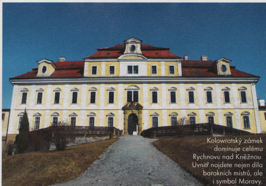
Kolowratský zámek dominuje celému Rychnovu nad Kněžnou. Uvnitř najdete nejen díla barokních mistrů, ale i symbol Moravy.