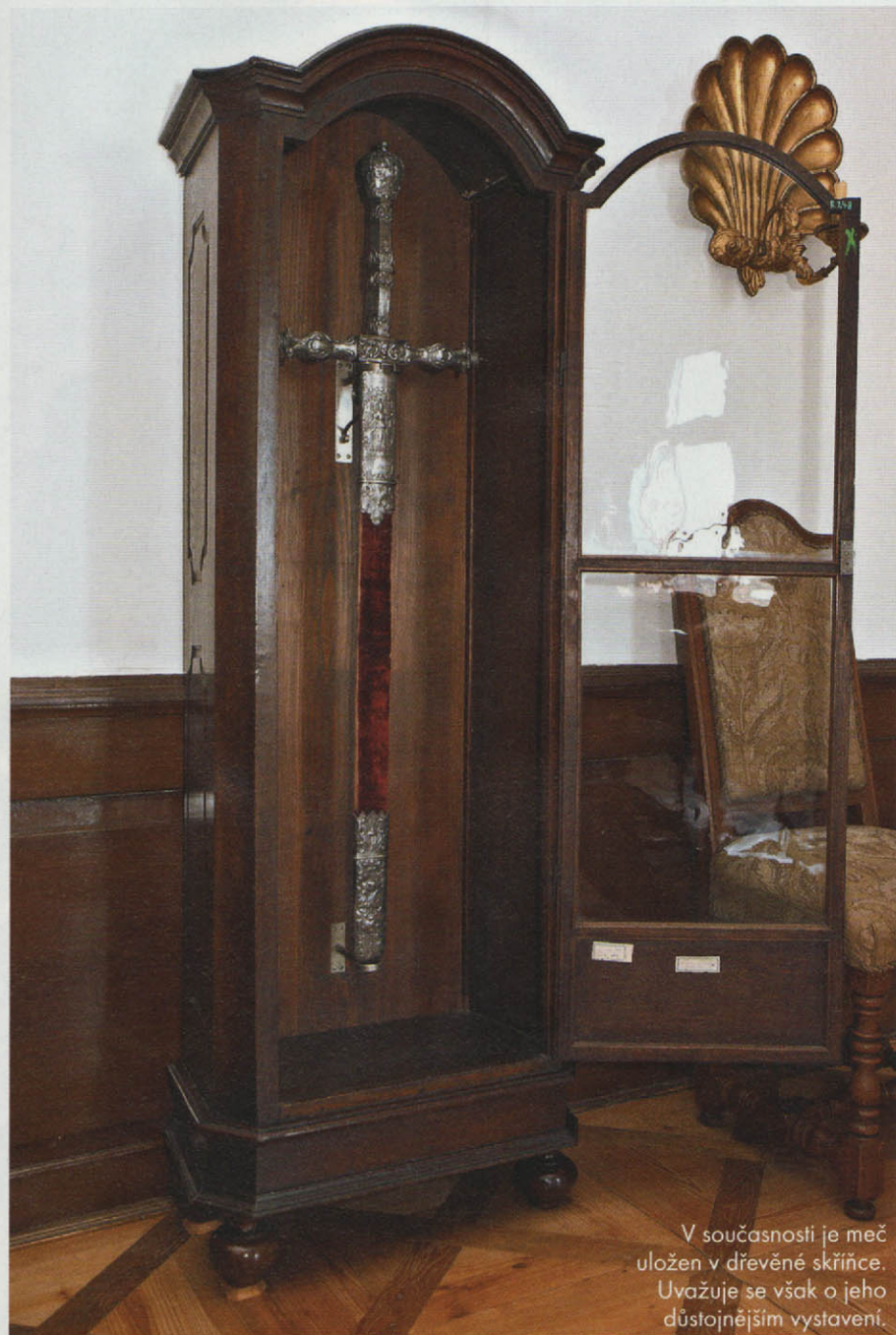
V současnosti je meč uložen v dřevěné skřínce. Uvažuje se však o jeho důstojnějším vystavení.