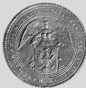
Pečeť moravských stavů na listině z 18. století. Moravský zemský archiv v Brně.

První písemná zmínka o moravské zemské pečeti pochází z 18. června 1477. Sněmovní pečete ze 16. až 19. století nesou vyobrazení anděla držícího zemský znak. Přivěšeny jsou na zlaté a červené šňůře.