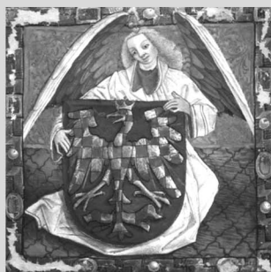
Illuminace na erbovní listině ze 7. prosince 1462. Moravský zemský archiv v Brně.

V modrém štítu je zlatě a červeně šachovaná, napravo hledící rozkřídlená orlice, se zlatou korunkou na hlavě, se zlatým zobcem, zlatými pařáty a s červeným jazykem. Strážcem štítu je postava anděla.